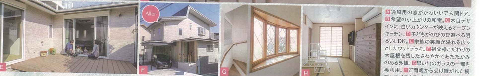
A 通風用の窓がかわいいア玄間ドア。 B 希望の小上がりの和室。 C 木目デザインに、白いカウンターが映えるオープンキッチン。 D 子どもがのびのび遊べる明るいLDK。 E 家族の笑顔が溢れる広々としたウッドデッキ。 F 祖父様こだわりの大屋根を残したさわやかであたたかみのある外観。 G 思い出のガラスの一部を再利用。 H ご両親から受け継がれた桐だんすが収まるように考えられた和室。