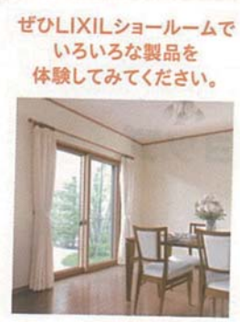
ぜひLIXILショールームでいろいろな製品を体験してみてください。

施工店のコメント ご要望に沿って、既存の部分を残しながらリフォームを進めました。以前は、廊下が空間を分断したので、LDKに光や風が入りにくかったため、LDKを広く取り、開放的にしました。構造体など、引き続き使えるところは残し、耐震補強や断熱工事を施して快適さをアップしました。また、ご主人のお母様が、ガラスの一部残してほしいと希望され、LDと和室を仕切る壁のハイサイドライトと、階段室のアクセントに再利用。その他にも、2階子ども室の出窓や祖父様こだわりの大屋根も素敵だったので、活かしました。