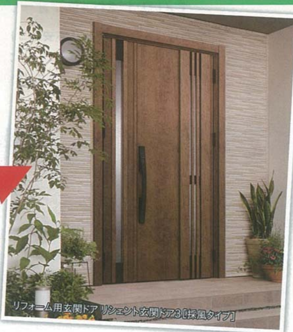
リフォーム用玄関ドア リシェント玄関ドア3 [採風タイプ]