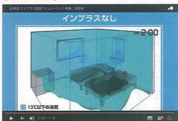
インプラスなし 昭和55年相当のお住まい 30年以上前の家はこの基準で建てられています。