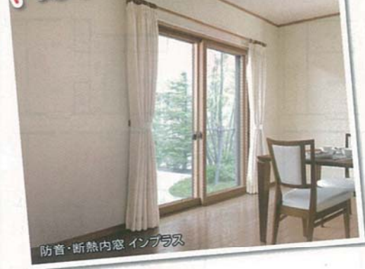
防音・断熱内窓 インプラス

断熱効果に優れた素材と二重窓で生まれる空気層が室内の熱を外に伝えにくくし、断熱効果を発揮します。また、省エネ効果も大幅にアップします。