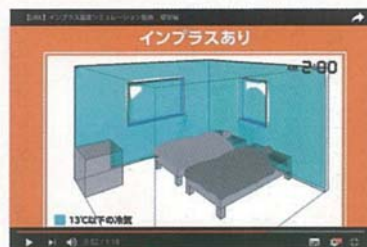
インプラスあり 左記お住まいに内窓設置

断熱材:グラスウール30mm/窓:アルミサッシ単板ガラス/建築地:東京1月 AGC-LIXILウインドウテクノロジー(株) 設備:ソフト:SIM/HEAT+フローデザイナー ※シミュレーション条件:外気温17°C、20°CエアコンOFF後1時間で6°Cの冷気の発生状況